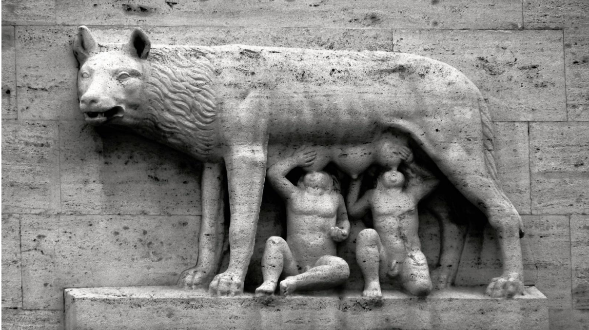
Die Säugung von Romulus und Remus